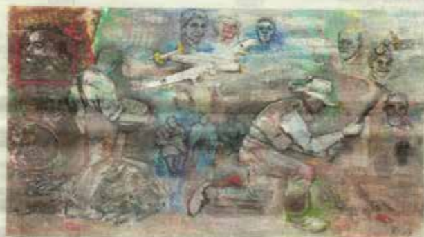
FORSTERKET REALISME: Johan Knoffs «Steinhoggerne III» låner både tittel og figurer fra Gustave Courbets maleri fra 1849.