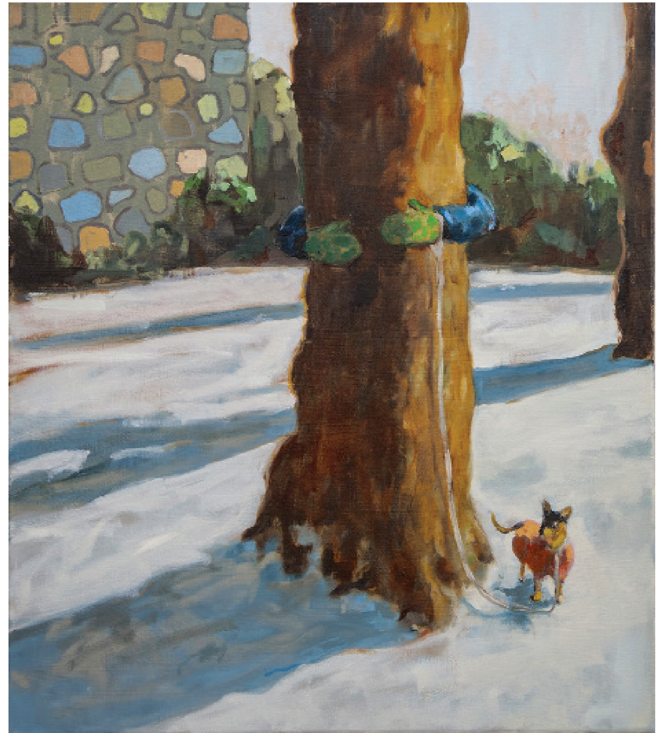
Endre Aalrust Hug 2023 olje på lerret, 80 x 70 cm