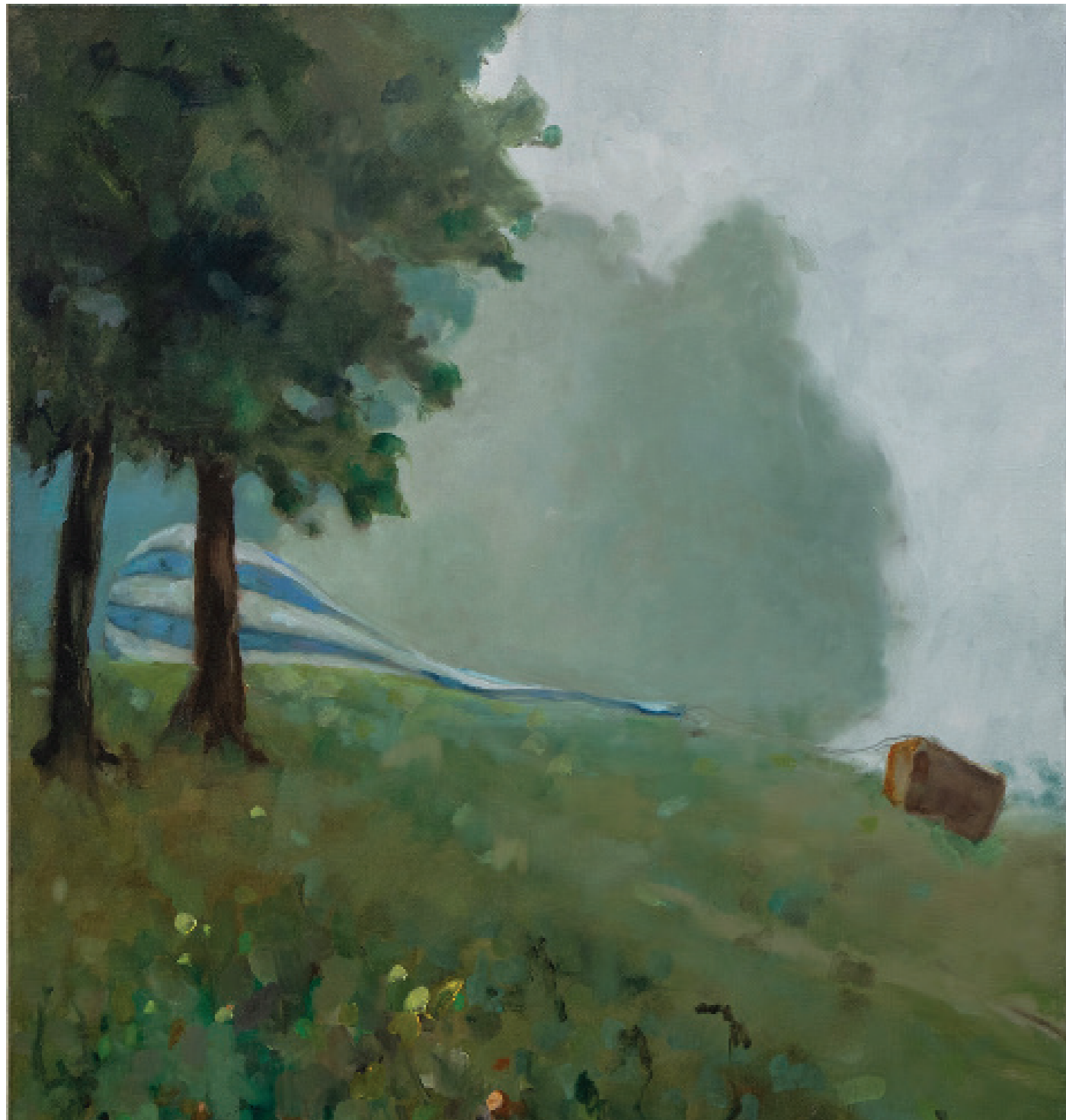
Endre Aalrust Deflated (Fog) 2023 olje på lerret, 80 x 70 cm