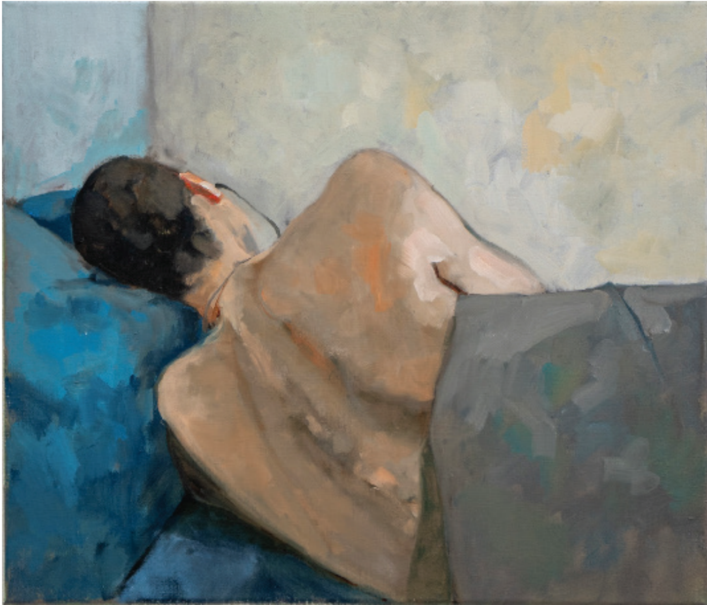
Endre Aalrust Pato, morning 2023 olje på lerret, 50 x 60 cm