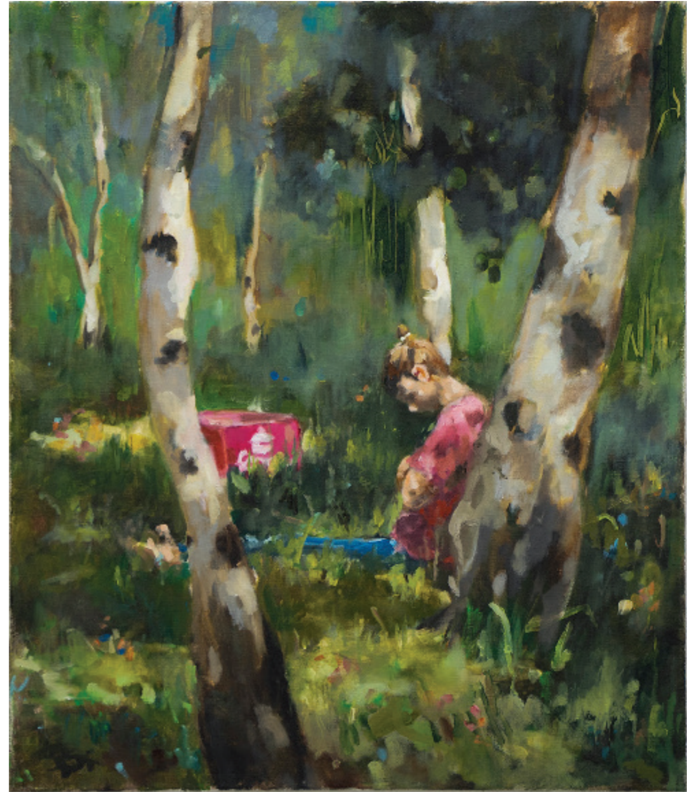
Endre Aalrust Lunch 2023 olje på lerret, 70 x 60 cm